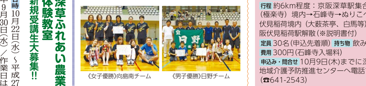
〈女子優勝〉向島南チーム

深草ふれあい農業体験教室 新規受講生大募集!! 日時10月22日(水)〜平成27年9月30日(水) / 作業日は平日 ※10月22日(水)14時から東部農業振興センターにて新規受講者説明会 内容:たけのこ畑の管理作業研修 ※作業は原則週1回(水曜日)、収穫作業のみは参加は不可 定員20名(応募多数の場合は抽選) 費用1人年間3千円(別途料金が必要な場合あり) 申込み 復讐ハガキに住所氏名(フリガナ)、年齢、電話番号を記入のうえ、同センター(〒612-0873 深草瓦町61)まで。10月3日(金)消印有効 問合せ 同センター(☎611-3340)