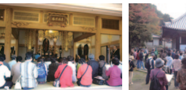
《優勝》 羽東師Aチーム

11月3日、秋晴れの下、西京総合運動公園他で市民スポーツフェスティバルが開催され、伏見区からは、リレ、グラウンド・ゴルフ、ソフトバレーボール、ベタンクに出場しました。 小学生男女混合400mリレーでは砂川チームが6位入賞、グラウンド・ゴルフ大会では向島チームが5位入賞、住吉チームが6位入賞、ソフトバレーボールでは淀南チームと久我チームが優秀チームとしてそれぞれ表彰されました。 その他各種目においても熱戦が繰り広げられ、伏見区は総合成績で10位となりました。