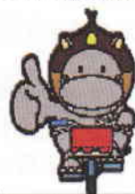
京都府警察ひったくり防止カバ-推進キャラクタ-「くりカバ」