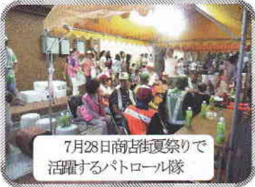
7月28日商店街夏祭り で活躍するパトロール隊

の短縮を目標として、防犯活動を遂行していきます。 地域の防犯・防災・防火活動に、二ノ丸