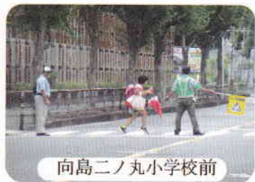
向島二ノ丸小学校前

猛暑続きの8月26日、京都市の小学校では2学期が始まり、向島二ノ丸小学校でも楽しかった夏休みを過ごした児童達が登校してきました。