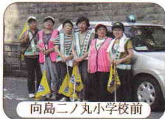
向島二ノ丸小学校前

午後3時半頃向島二ノ丸小学校前に集結して、下校している学童に「お帰り」の声をかけをしながらの横断歩道にて横断誘導をしてきました。