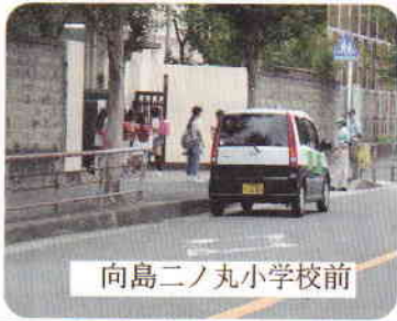
向島二ノ丸小学校前

中には、既に下校していた、学童と下校中の学童が、横断中に出くわし、遊びの相談を横断歩道の中で立ち止まって話に夢中になり、誘導員からどちらかの歩道に上がってからするようにとの声をかけられ、「ハイ」といって同じ方向に渡る姿も見かけられました。