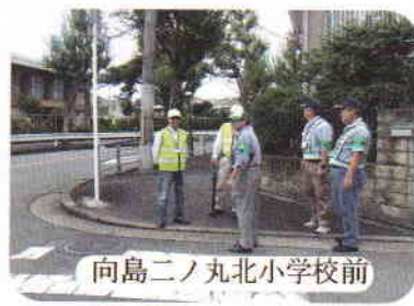
向島二ノ丸北小学校前

「子供見守り隊」の隊員は、学校近隣の通学時の危険箇所、また近くの公園周辺もパトロールしていました。