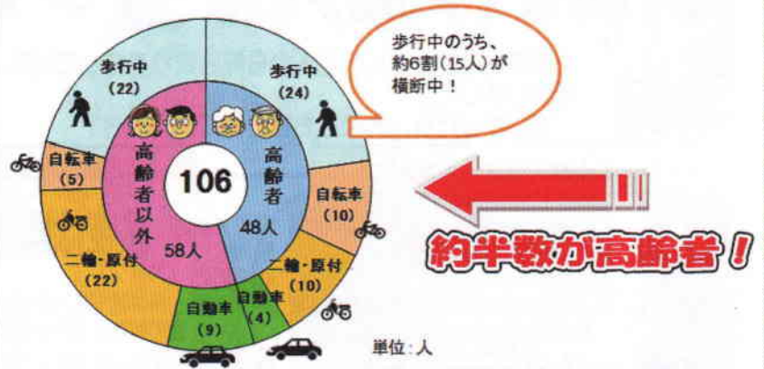
平成24年中 交通事故死者（状態別）