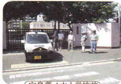
向島藤ノ木小学校前

向島藤ノ木小学校前で台流し、学童の登下校の安全に対しての意見交換をし、特に藤ノ木学区周辺では、登校時に痴漢が発生した事案があり、通学道路の更なる安