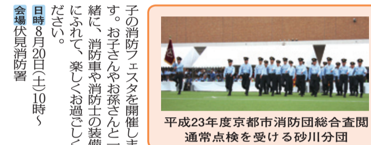
消防フェスタ開催の様子

大切な命を救うために AED(エーイーイー)を「ご存知ですか?」 AEDとは、心肺停止状態の方の心電図を自動的に解析して、必要な場合には、音声ガイドに従って、電気ショックを与えることができる医療機器です。 ●普通救命講習を受講しましょう 伏見消防署及び醍醐消防分署では、普通救命講習を実施しています。心肺蘇生法とともに、AEDの使用法と止血法を学んでいただけます。正しい応急手当の方法を身に付けましょう。団体での受講希望の方は各署の警防課教習係までお問い合わせください。