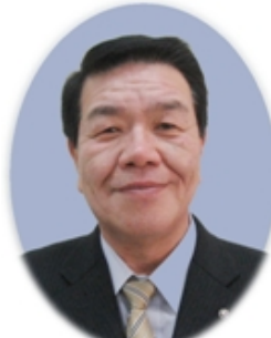
伏見区長 北島 誠一