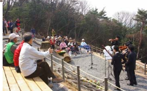
大岩山展望所竣工式の様子