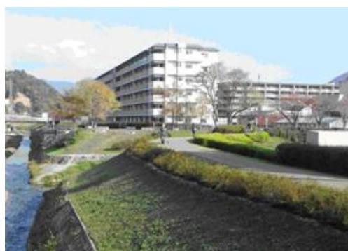
低木植栽を行った山科川