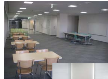
写真上：オープン会議スペース