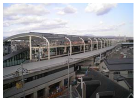
完成した下り線ホーム