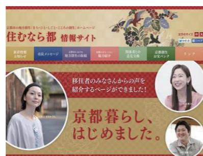
京都市の地方創生ホームページ「住むなら都」情報サイト

京都市では、この動きを踏まえ、人口減少の歯止めと、東京一極集中の是正を目指し、市民の皆様から多数の意欲的な取組提案等をいただき、本年9月に「まち・ひと・しごと・こころ京都創生」総合戦略を策定しました。