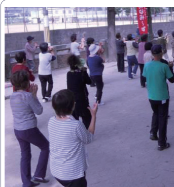
身近な地域の中で仲間とともに健康づくり

ていただくなど、市民の皆様の主体的な健康づくりを地域の中で広めていき、全市的な運動として推進したいと考えておりますので、ご協力をお願いします。