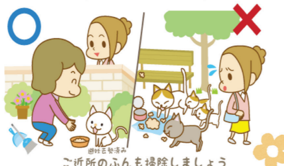
ご近所のふんも掃除しましょう

また、地域の皆様が適切に管理する野良猫に、無償で避妊去勢手術を行う制度(まねこ活動支援事業)や、野良猫への給餌活動を届け出る制度なども設けていますので、ご活用ください。