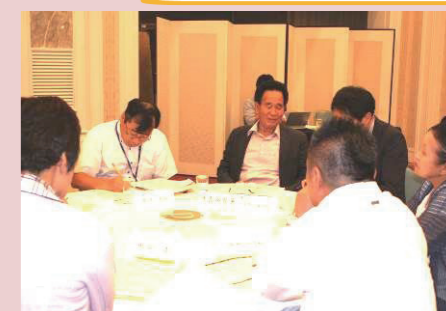
各テーブルでは、区の代表者と区長が積極的に意見交換