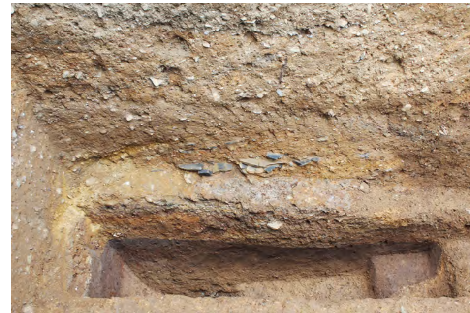
2区 造成土堆積状況