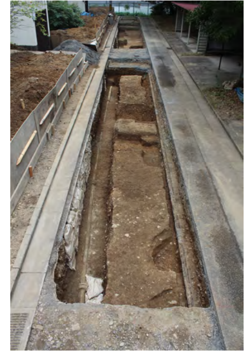
1区 第1遺構面遺構検出状況