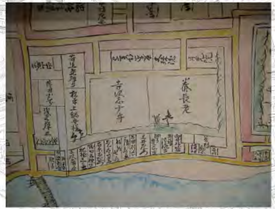
伏見御城郭並武家屋敷取之図 対象部分抜粋