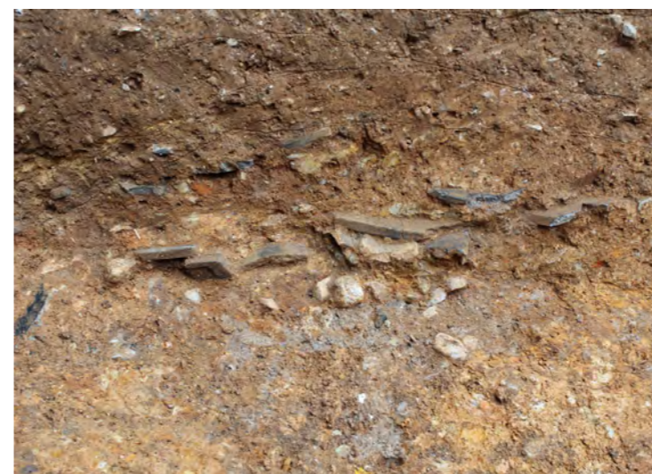
2区 造成土中遺物出土状況