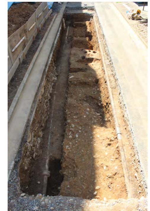
1区 第2遺構面遺構検出状況