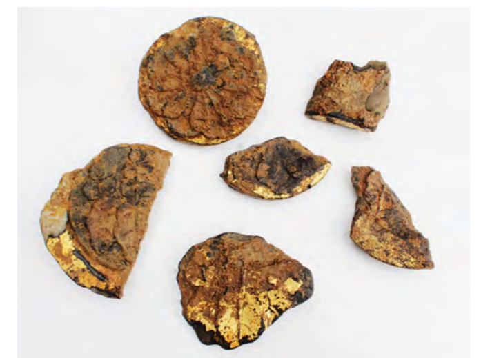
1区 造成土出土金箔瓦