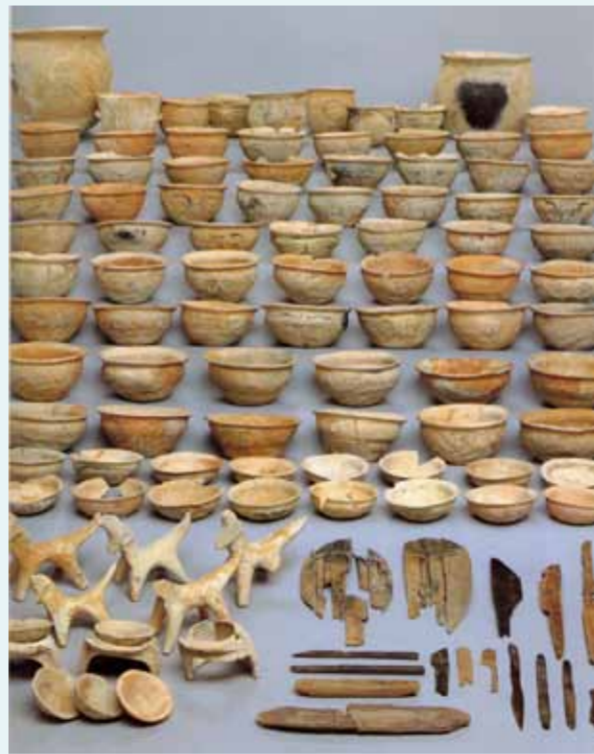
祭祀に使用された墨書人面土器と土馬や木製品（市指定文化財）