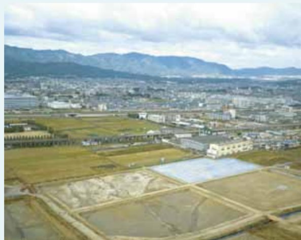
上空から見た水田跡