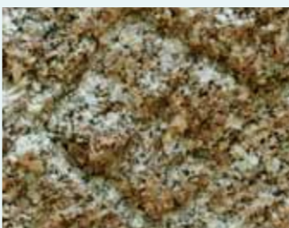
前田利常・利長の刻印