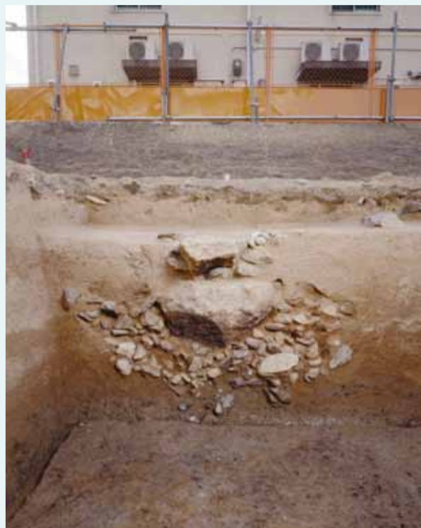
米蔵の礎石根固め断面 礫敷きの上に大石を重ねています