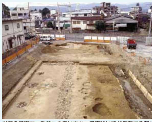
米蔵の基礎跡 手前から奥に向かって帯状に礫が集石する部分

2003年の発掘調査では米蔵の基礎跡と礎石跡を発見しました。基礎跡は「布基礎」とよばれる帯状に礫を詰めた基礎工法で、幅2～3m、深さは約1.5mありました。米蔵跡は東西約39m、南北約8mの長大な規模でした。