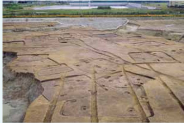
河川に囲まれた集落跡