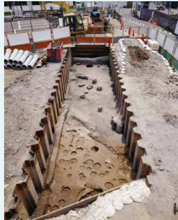
淀城下層で見つかった道路跡

2004年の調査では淀城築城以前の大坂街道跡を発見しました。道路の幅は約7.5mありました。また道路跡に隣接する調査区では、町屋の跡も見つかり、古淀城の城下町の様子が明らかになってきています。