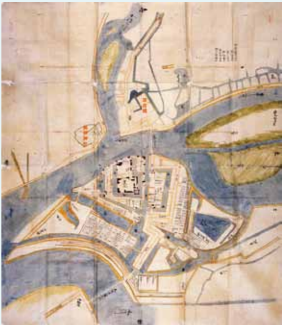
『淀城大絵図』 京都大学工学研究科建築学専攻蔵

永正元年（1504）納所に淀城（古淀城）が置かれましたが、文禄三年（1594）破却されました。元和九年（1623）に伏見城の廃城が決定され、京都守護の城として新たに淀城が築かれます。1987年に天守台の調査が行われ、淀城跡公園として整備されました。1999年から2010年にかけて京阪電気鉄道淀駅高架に伴う発掘調査が実施され、本丸の曲輪、内堀や外堀の濠、石垣、三の丸内の米蔵、淀城築城以前の道路と町屋などが発見され、古絵図などに示された、淀城の全体像が明らかになりつつあります。