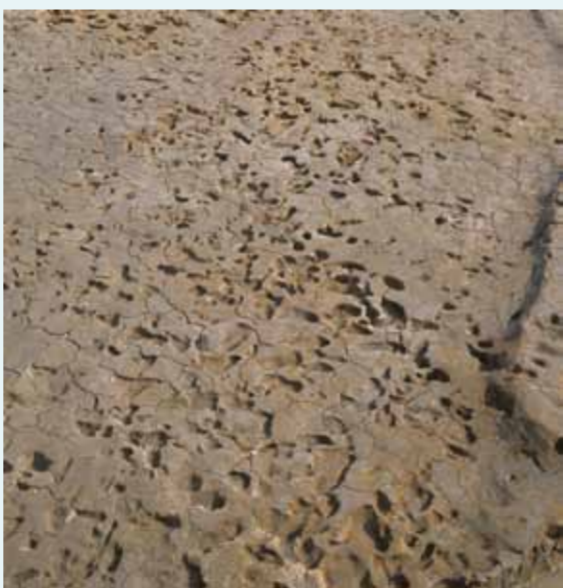
水田に残る無数の足跡