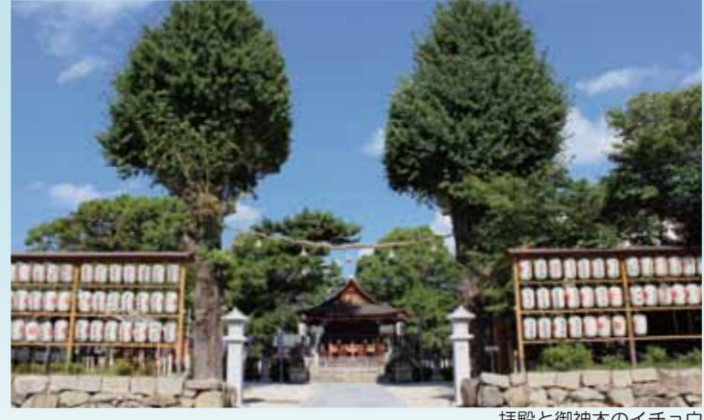
拝殿と御神木のイチヨウ

豊田秀吉の側室・淀殿の産所となった淀古城跡推定地の一角に、1626年に建立された法華宗の寺院です。寺の南側にある水路は淀古城の堀跡とされ、周辺には「北城堀」など城に関する地名が残ります。1868年の鳥羽・伏見の戦いで激戦地となり、本堂には砲弾の貫通跡が残されています。