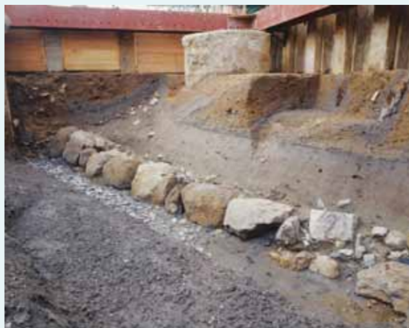
淀城中堀跡の石垣

2006年の発掘調査で旧淀駅下から中堀跡の西側石垣を発見しました。石垣は下に続いており、堀はさらに深くなっていました。さらに2010年の発掘調査でも中堀跡の西側石垣が見つかっていました。