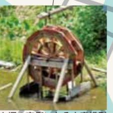
内堀の南側にある水車模型

淀川水車旧址(よどのかわせのみずぐるまきうし) 江戸時代の淀城には宇治川や淀川に面して二ヶ所の揚水用の大水車(直径約8m)があり、城内の庭園に川水を汲み上げる役割を担っていました。