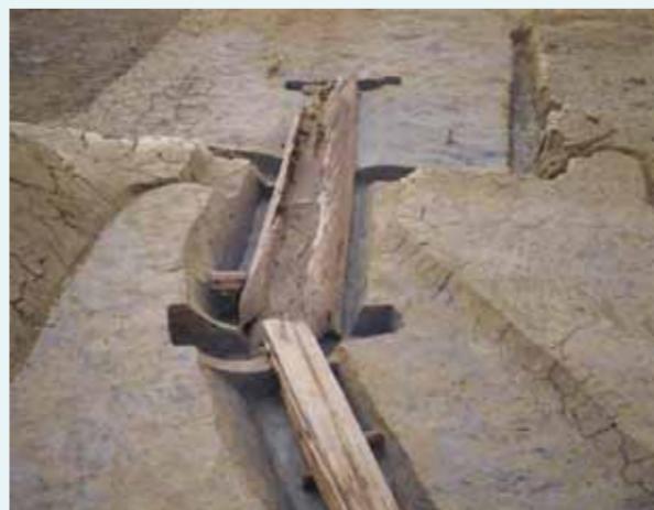
丸木船を転用した木樋