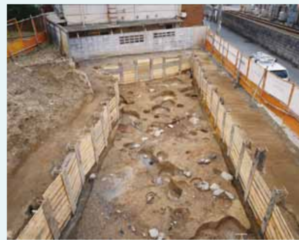
道路跡に隣接した町屋跡