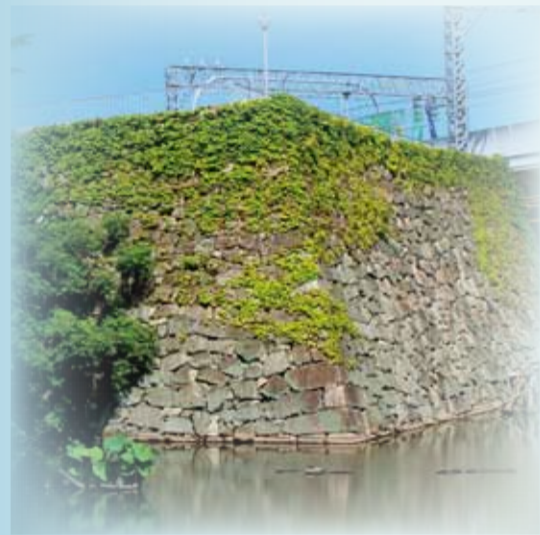
発行 京都市・(財)京都市埋蔵文化財研究所