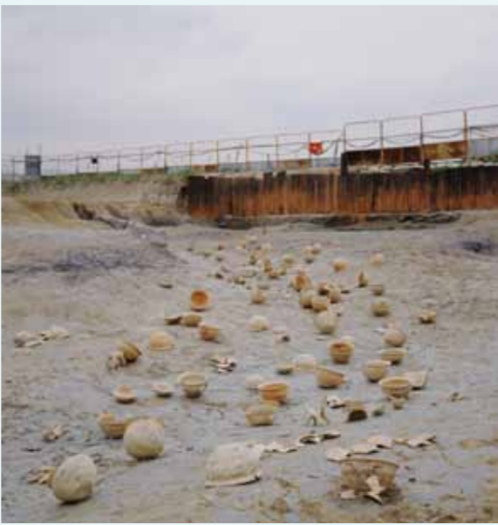
河川跡から出土した多数の墨書人面土器や土馬