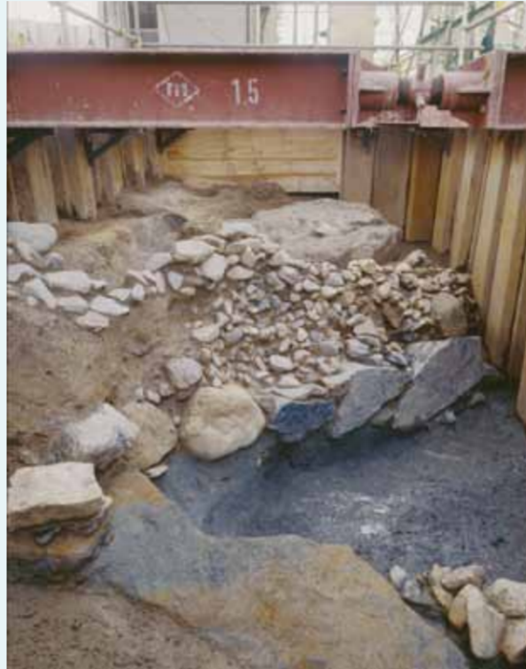
淀城中堀跡の石垣