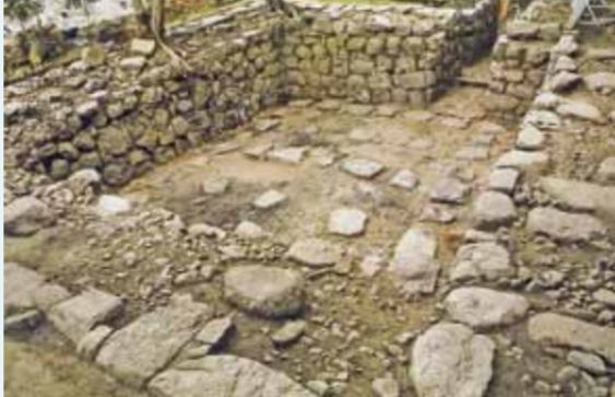
(写真掲載 『京の城～洛中洛外の城郭～』京都市文化財ボックス 第20集 京都市文化市民局文化芸術都市推進室文化財保護課発行)