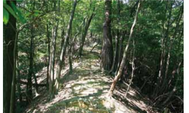
唐櫃越(野鳥遊園からの登山路より)

桂坂の北に控える山なみの描く稜線に唐櫃越と呼ばれる古道が走っています。この道は山陰街道の、いわばバイパス路で、南北朝の内乱期に京に優越し、あるいは敗退する武士達が丹波と京を往還した戦さ道でもありました。名前は唐櫃という運搬具(木箱)を運ぶのが精一杯の狭い道であったことに由来しています。