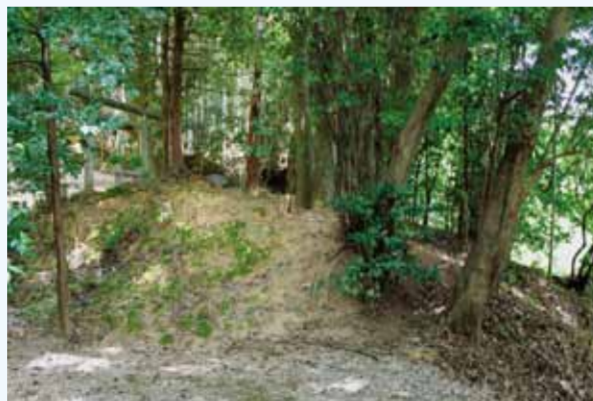
神社境内に残存する古墳