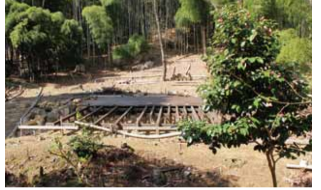
野外音楽堂(近日に完成予定)

峯ヶ堂は鎌倉時代に創建され、元弘の乱(1331)と応仁・文明の乱(1467～1477)により二度焼け落ちました。その峯ヶ堂跡に野外音楽堂が地元有志により開設されました。この音楽堂は間伐材でステージを造り、丸太や竹の根元を椅子に使い、自然を生かした造形が特徴です。