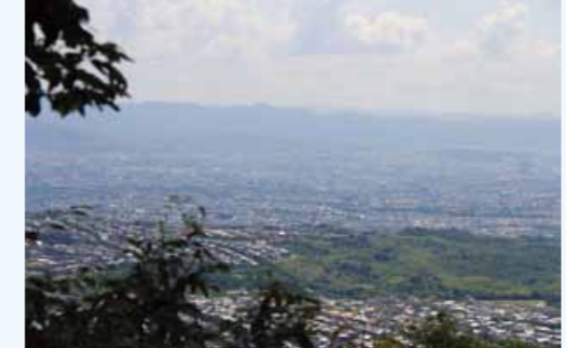
沓掛城跡から大枝・桂坂を望む