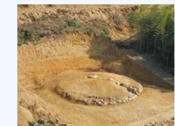
22号墳の発掘調査の様子