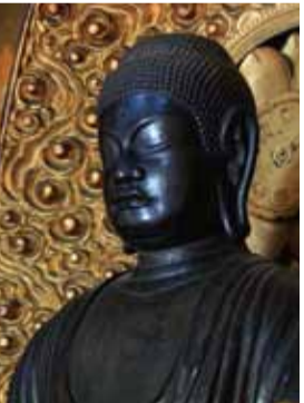
阿彌陀如来坐像(市指定文化財)

浄土宗西山派の寺院。寺伝によると1186年、法然上人の高弟・花元の開基とされ、現在の堂は1772年粟生(あお)光明寺僧呑海(どんかい)の中興で民家風です。本尊は平安時代初期の行基作と伝わる阿彌陀如来坐像です。峯ヶ堂にあったものが元弘の乱(1331)の戦火で難を逃れて唐櫃越山中の寺院に移され、後にこの寺に持ち込まれたと伝えられています。