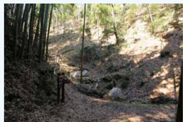
峰ヶ堂城跡の遠景

唐櫃越の南側には、13世紀に法華山寺が建てられました。通称「峰の堂」とも呼ばれていました。この寺は戦国時代に焼失し、その跡地に峰ヶ堂城が築かれ、軍事上の拠点となりました。これまでの分布調査により、寺の伽藍や石垣を利用して築かれたとみられる、堀切や土塁跡が確認されています。