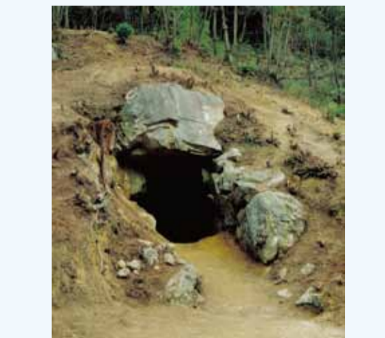
15号墳の石室入口と墳丘