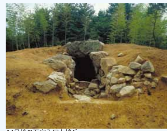
14号墳の石室入口と墳丘