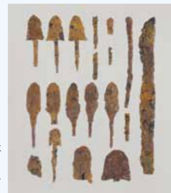
石室内から出土した鉄剣・刀子(とうす)等の鉄製品