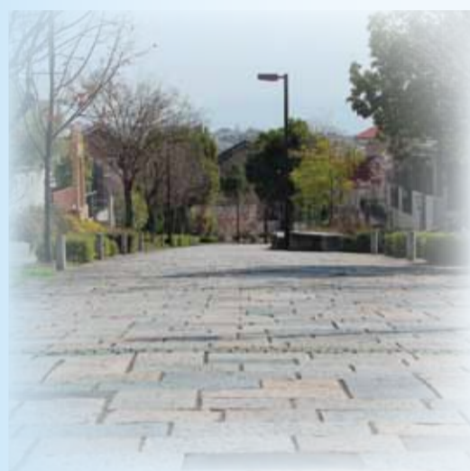
発行 京都市・(財)京都市埋蔵文化財研究所