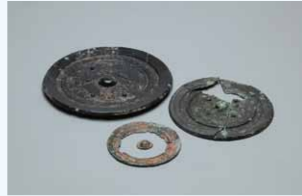
竪穴式石室内から出土した銅鏡

山陰街道の南側の丘陵上に位置する市内では最古とみられる前方後円墳の一つです。明治三十年（1897）年に発掘調査が行われ、埋葬施設である竪穴式石室から銅鏡3面と鉄剣が出土しています。墳丘は後世の削平により後円部の一部のみが残存しています。