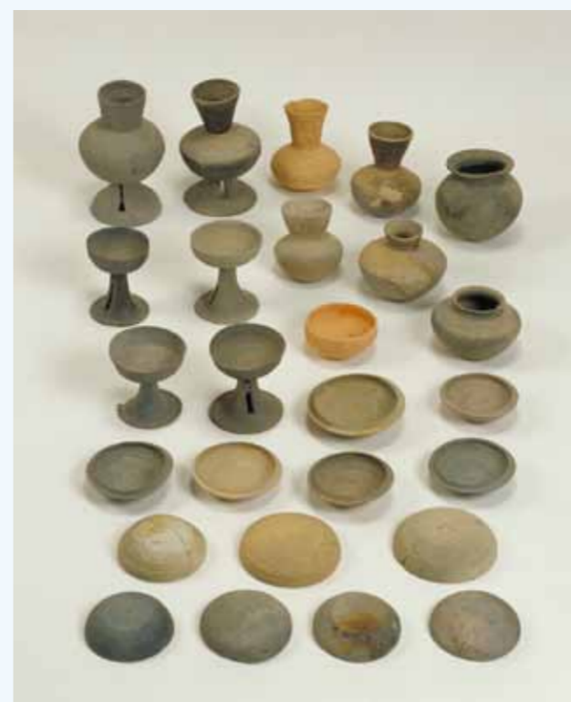
石室内から出土した土器類