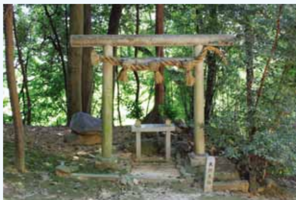
境内鳥居裏に露出している石室天井石の石材