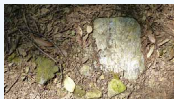
平坦地に残る礎石