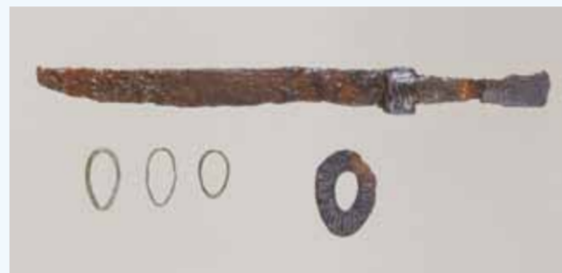
石室内から出土した銀象嵌(そうがん)の鉄刀と耳環