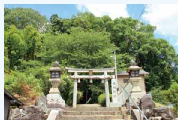
山陰街道沿いの大枝神社

山陰街道沿いの神社や陵墓近辺には古墳がいくつかみられます。沓掛町の大枝神社境内の本殿西側に残る古墳も、その一つで、径約11m、高さ約2mの円墳で、主体部の横穴式石室の天井石が境内鳥居の背後に露出しています。