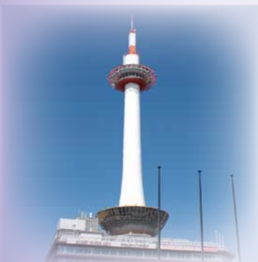
発行 京都市・(財)京都市埋蔵文化財研究所