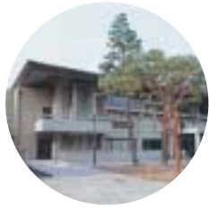
本館外観 Outside of the main building

相撲場 西京極総合運動公園内の相撲場が国体施設の整備により撤去されたことに伴い、建設したものです。