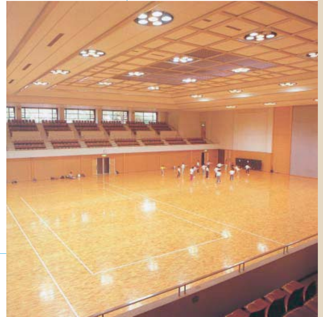
本館室内 Indoor of the main building