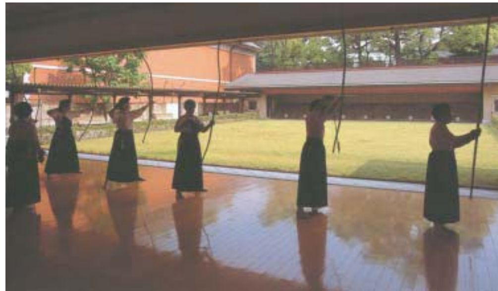
弓道場 Japanese archery hall