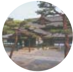
旧武徳殿外観 Outside of the Kyu-Butokuden