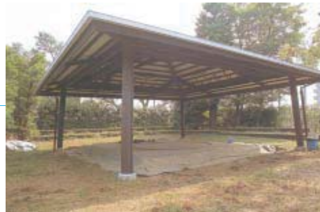
相撲場 Sumo wrestling place