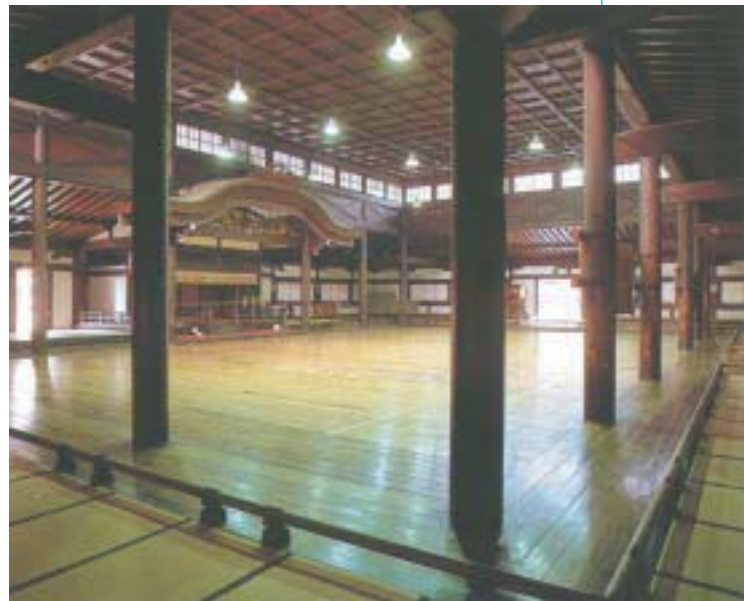
旧武徳殿室内 Indoor of the Kyu-Butokuden