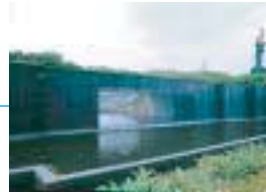
補助競技場 Sub field and track and ball game field