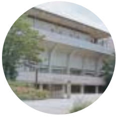
陸上競技場兼球技場入口 Entrance of the field and track and ball game field